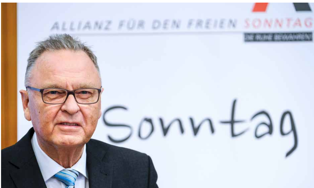
Prof. Dr. Dr. h.c. Hans-Jürgen Papier, Präsident des Bundesverfassungsgerichts von 2002 bis 2010

Die Verfassung gewährleistet und schützt die Institution des Sonn- und Feiertags unmittelbar. Allerdings ist der Gesetzgeber berufen, Art und Ausmaß des Schutzes auszugestalten. Hierbei ist er allerdings nicht völlig frei. Die Verfassung statuiert ein Regel-Ausnahme-Verhältnis. Grundsätzlich hat die typische „tagtägliche Geschäftigkeit“ an Sonntagen zu ruhen. Der verfassungsrechtlich garantierte Sonntagsschutz ist nur in begrenztem Maße einschränkbar. Ausnahmen sind nach der Rechtsprechung des Bundesverfassungsgerichts nur zur Wahrung höherer und zumindest gleichwertiger Rechtsgüter möglich. Immer muss der den Sonntagsschutz ausgestaltende Gesetzgeber ein hinreichendes